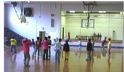
雨のため体育館で遊ぶ子ども達・2/18

安全対策のため、全地球測位システム（GPS）機能付きの携帯電話や発信器などを子どもに持たせ、登下校中どこにいるかを保護者や学校が把握できる仕組みを導入する小学校もあります。こうした対策が「役立つ」と思う人は67%、「役立たない」は22%でした。一方で、このような対策への評価では、「行き過ぎだ」は36%で、「そうは思わない」が53%と半数を超えたとのことです。